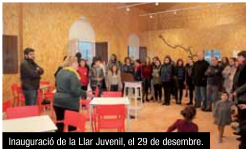
Inauguració de la Llar Juvenil, el 29 de desembre.